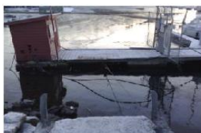
18. desember 2007

Samme dag forberedte Statsbygg fjerning landfestet til flytebryggen. Sjøsenderet fjernet selv broen før det kom så langt. Det er uklart hvordan staten hadde tenkt seg at de som jobber og bor på Killingen skulle komme til og fra jobb og skole i perioder med utrygg is.