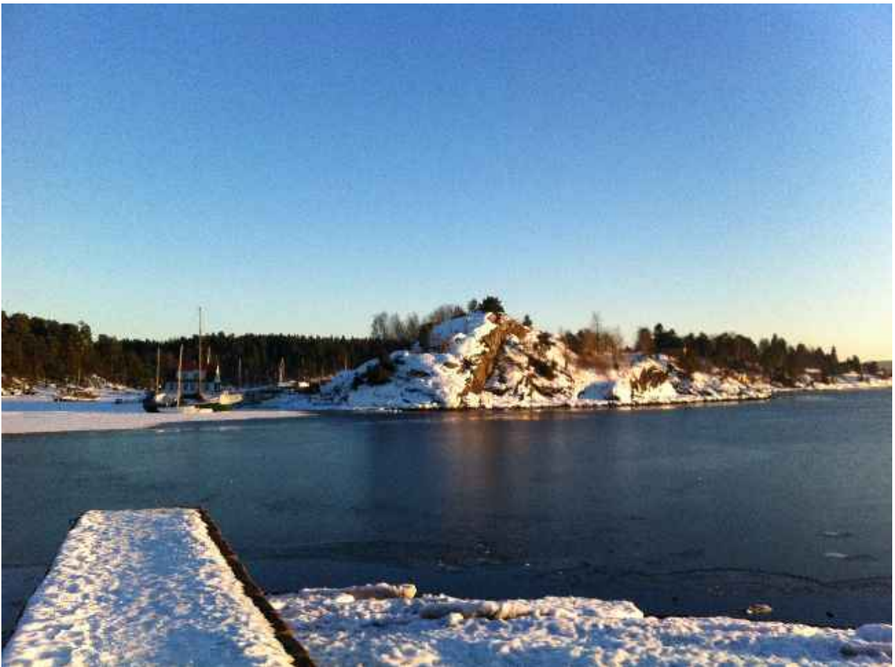
Isen forsvinner (M. Watterud, 2013)

Torsdag 13. mars 2013, kl 1900 Dronningen, Huk aveny 1