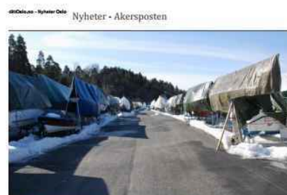
VL STA TOMT: Statens søknad har vært i opplag på statens tomt med flere andre alternativer. Arkivfoto