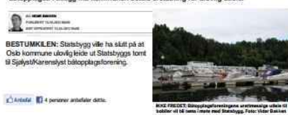
RISE FREDET: Båt opplagt foreningens utleiested utenfor de båt biler vil bli innlagt med Statsbygg.

Statsbygg forlanger 750.000 i leie for sin del av opplagt tomt. Det blir for dyrt for båt opplaget. I tillegg må kommunen betale erstatning for ulovlig utleie.